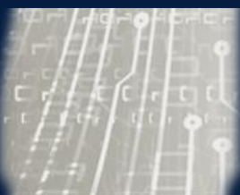
DATA, COMPUTING & DIGITAL