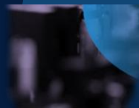
PHYSICAL SCIENCE & ENGINEERING